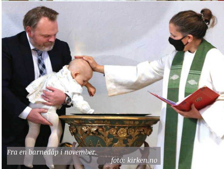
Fra en barnedåp i november.