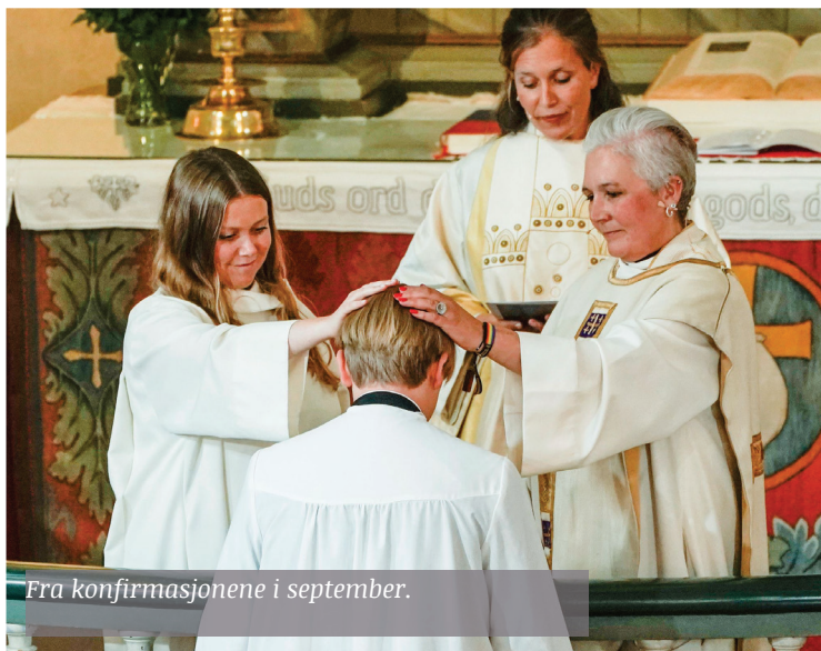
Fra konfirmasjonene i september.