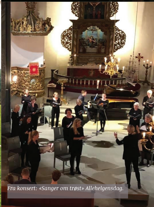
Fra konsert: «Sanger om trøst» Allehelgensdag.