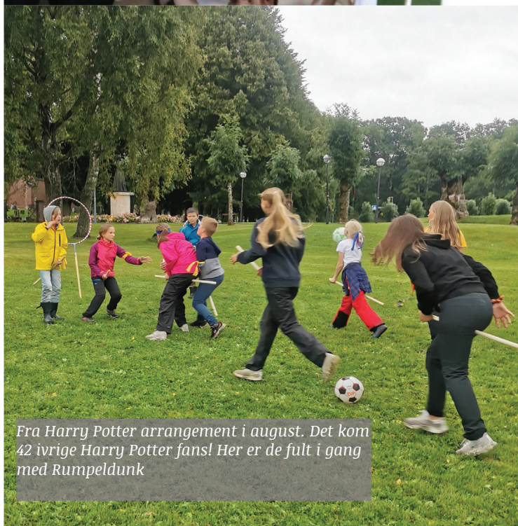
Fra Harry Potter arrangement i august. Det kom 42 ivrige Harry Potter fans! Her er de fullt i gang med Rumpeldunk