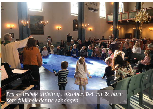
Fra 4-årsbok utdeling i oktober. Det var 24 barn som fikk bok denne søndagen.